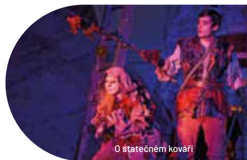
O statečném kováři