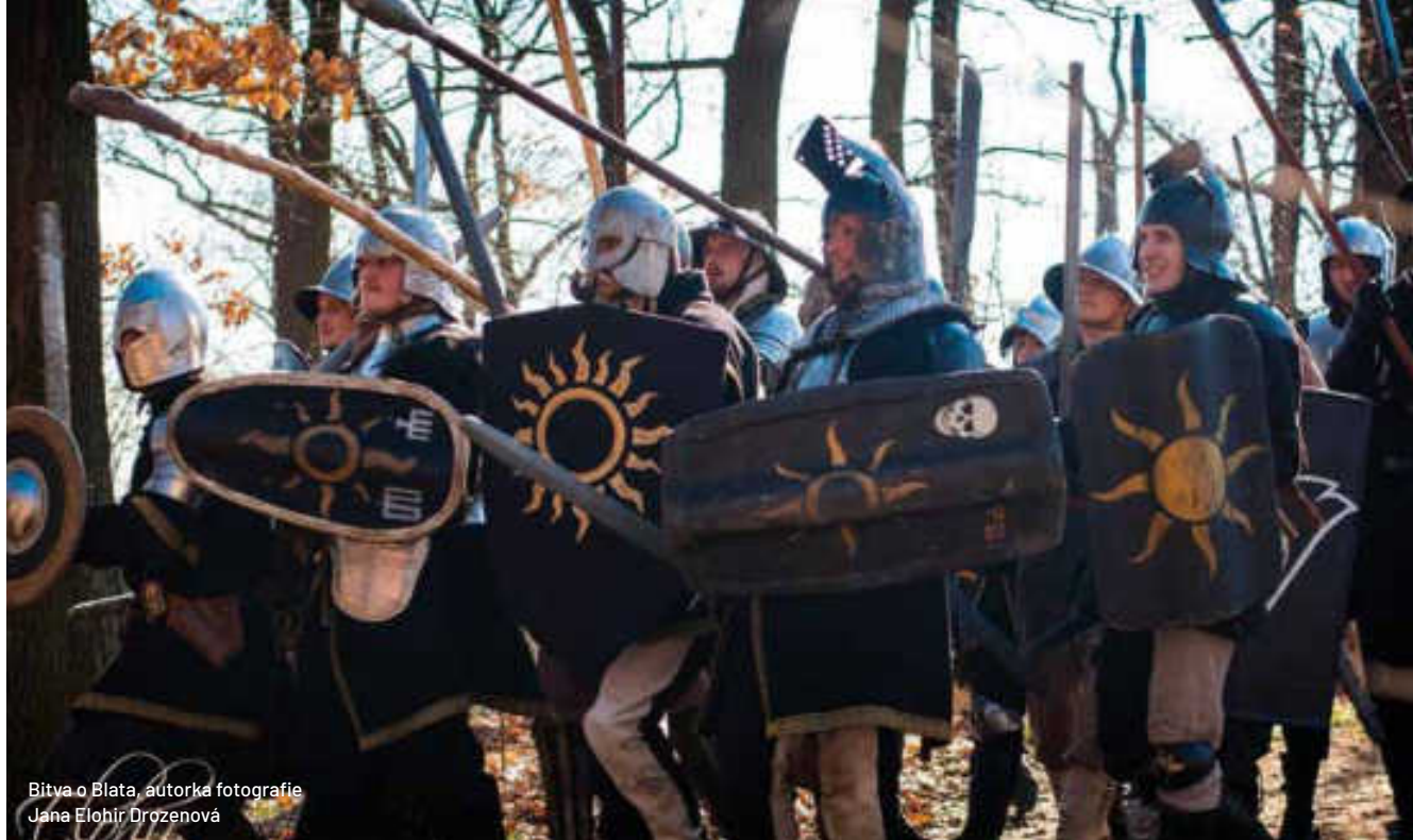
Bitva o Blata