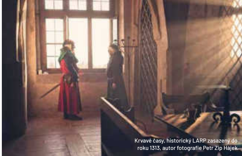
Krvavé časy, historický LARP zasazený do roku 1313