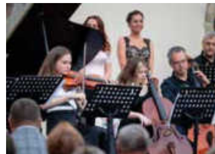
Ostrava, jež začínají 19. července v industriální oblasti Dolních Vítkovic.

Blíží se léto a s ním dlouhé slunečné dny a teplé večery. Čas ideální pro návštěvu festivalů. Česko se v průběhu následujících měsíců promění na rušné dějiště mnoha akcí, ze kterých si vybere snad každý zájemce. Pojďme se společně podívat na ty nejzajímavější z nich.